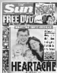
《太阳报》当年对布朗儿子病情的报道

我们将继续就布朗先生的指责进行调查,并希望布朗先生能够提供更多的细节,以便我们找出事实的真相。 快报记者 潘文军 编译