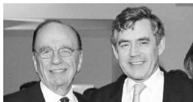
布朗和默多克也曾亲密无间

13日,英国议会下院大众文化、媒体和体育委员会决定,就窃听事件传唤默多克、其子詹姆斯以及曾任《世界新闻报》总编辑、现任英国国际新闻公司总裁的布鲁克斯,要求他们在7月19日就窃听和贿赂警察等事件出席听证会,接受质询。