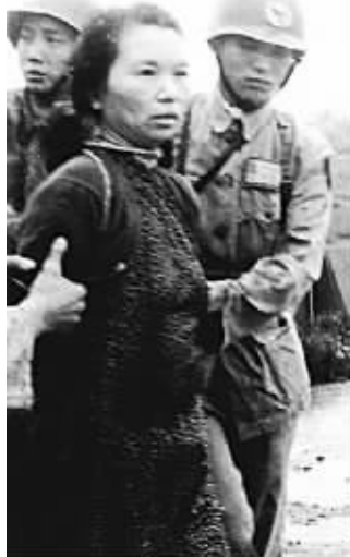
1950年6月, 朱枫于台北马场町刑场就义 资料图片