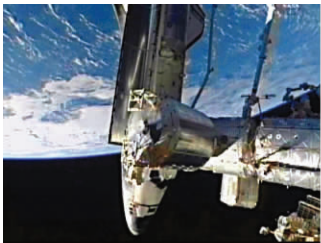
“阿特兰蒂斯”号航天飞机与空间站对接在一起

“阿特兰蒂斯”号航天飞机10日与国际空间站对接,实现美国航天飞机与国际空间站的“最后一次亲密接触”。