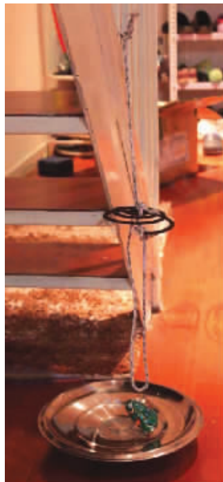
网友自制蚊香闹钟图片

古代有闹钟吗? 闹钟是什么样的? 新片《武侠》热映,闹钟成为微博热门话题。原因是电影《武侠》结尾部分,甄子丹家里出现了一个“蚊香闹钟”画面,让很多网友印象深刻。很多网友在微博中表示,“结尾处的蚊香闹钟是电影的一大亮点”、“蚊香闹钟不错,很稀饭,有机会COSPLAY一个”。