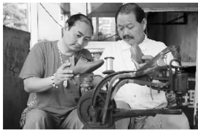
这父子俩长得还挺像