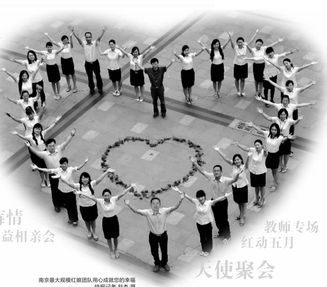
南京最大规模红娘团队用心成就您的幸福