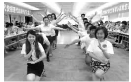
“百合之夏”大型时尚交友活动

本次活动解释权归现代快报爱周刊和现代红娘所有。现代快报员工均不得参加本次抽奖活动。