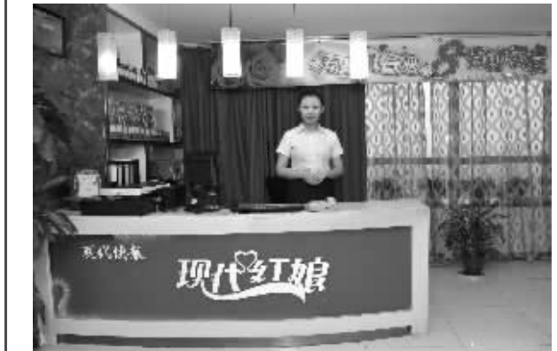
现代红娘新街口精装1000平米服务大厅