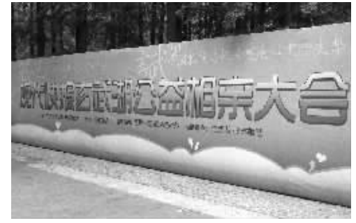
2011年5月21日起, 现代快报公益相亲大会每周六相约玄武湖