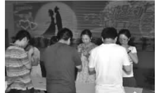
2010年七夕节, 现代红娘为单身朋友搭“鹊桥”