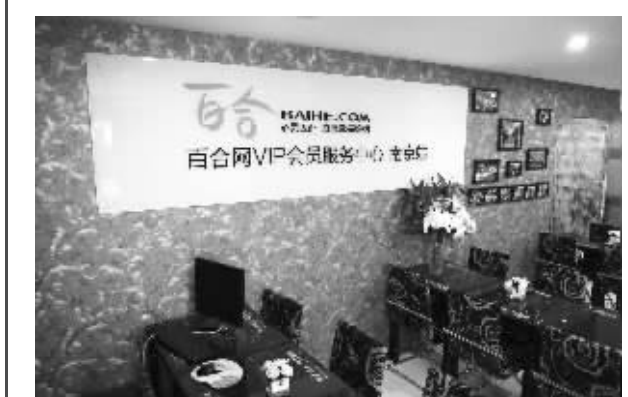
2010年七夕节, 百合网VIP会员服务中心落户现代红娘