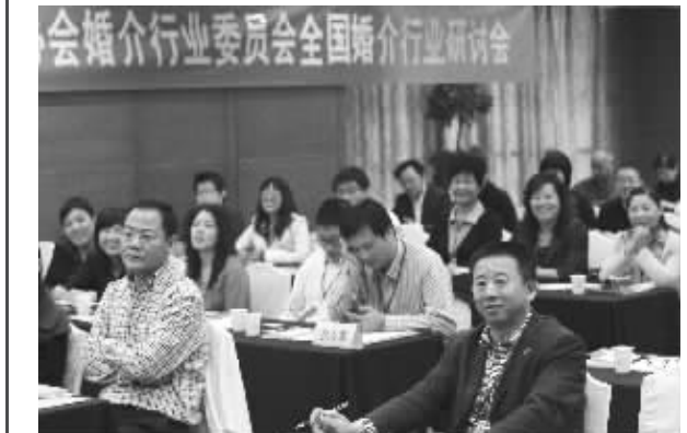
2010年10月, 现代红娘在宁成功举办全国婚介行业研讨会