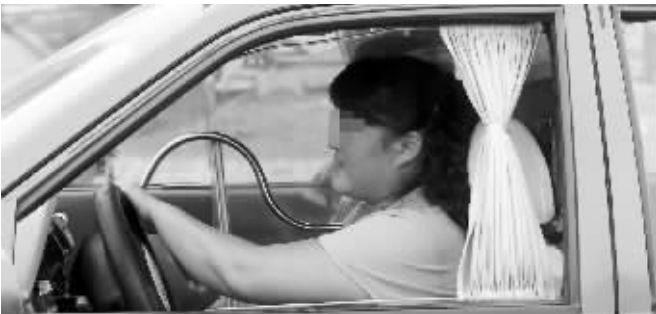
见义勇为的陈的姐(为了保护当事人,图片经过技术处理)

他俩骑上电动车,从院子北门出来,沿许府巷向西行驶。这个院子内有银行与长江科技园两家单位,“事后特地调出监控录像,证实他们是早上9点18分离开的。”小院北门的门卫师傅说,“银行门口有两个监控探头,院子大门有3个监控探头。”