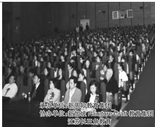
承办单位:新周知教育集团 协办单位:新加坡 Naurture Craft 教育集团 江苏长三角教育

领票点: ●中山北路95号江苏议事园大厦19楼1915室 ●新街口大众书局二楼好记星专柜 ●新街口新华书店二楼好记星专柜