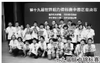
第十九届世界脑力锦标赛

为期4天的第19届世界脑力锦标赛于2010年12月5日晚在广州落下帷幕,共诞生了29位新的世界记忆大师。中国队以5金3银6铜的奖牌数位列本次大赛的亚军。