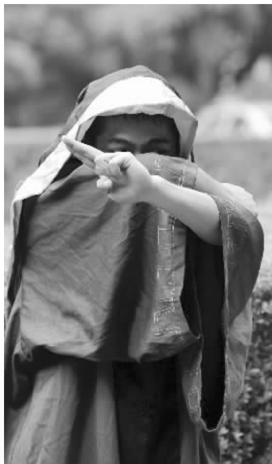
毕业留影,搞怪是常态