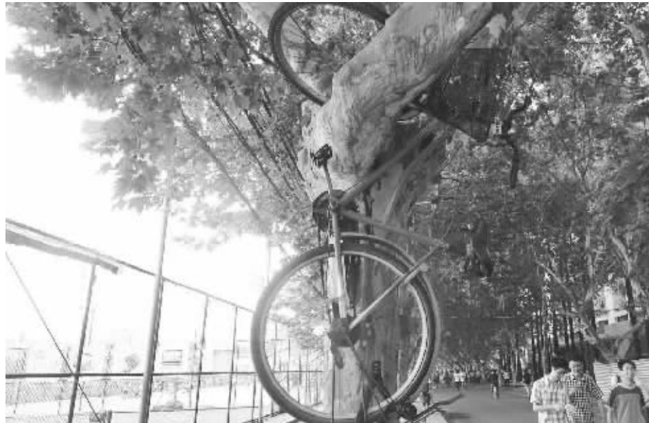
南京理工大学校园里,毕业生们导演的“行为艺术”——不走寻常路的自行车