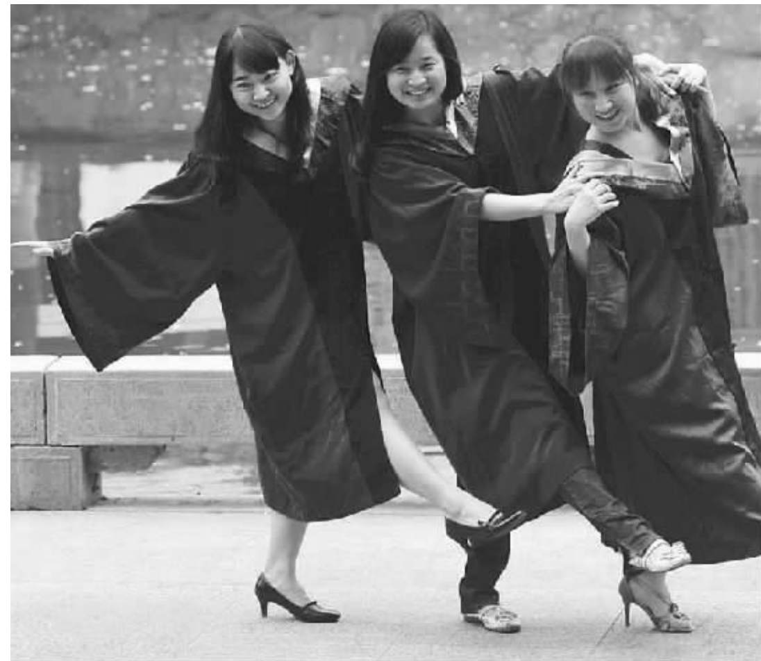
毕业季的气氛,让平时矜持的美眉们也放松起来