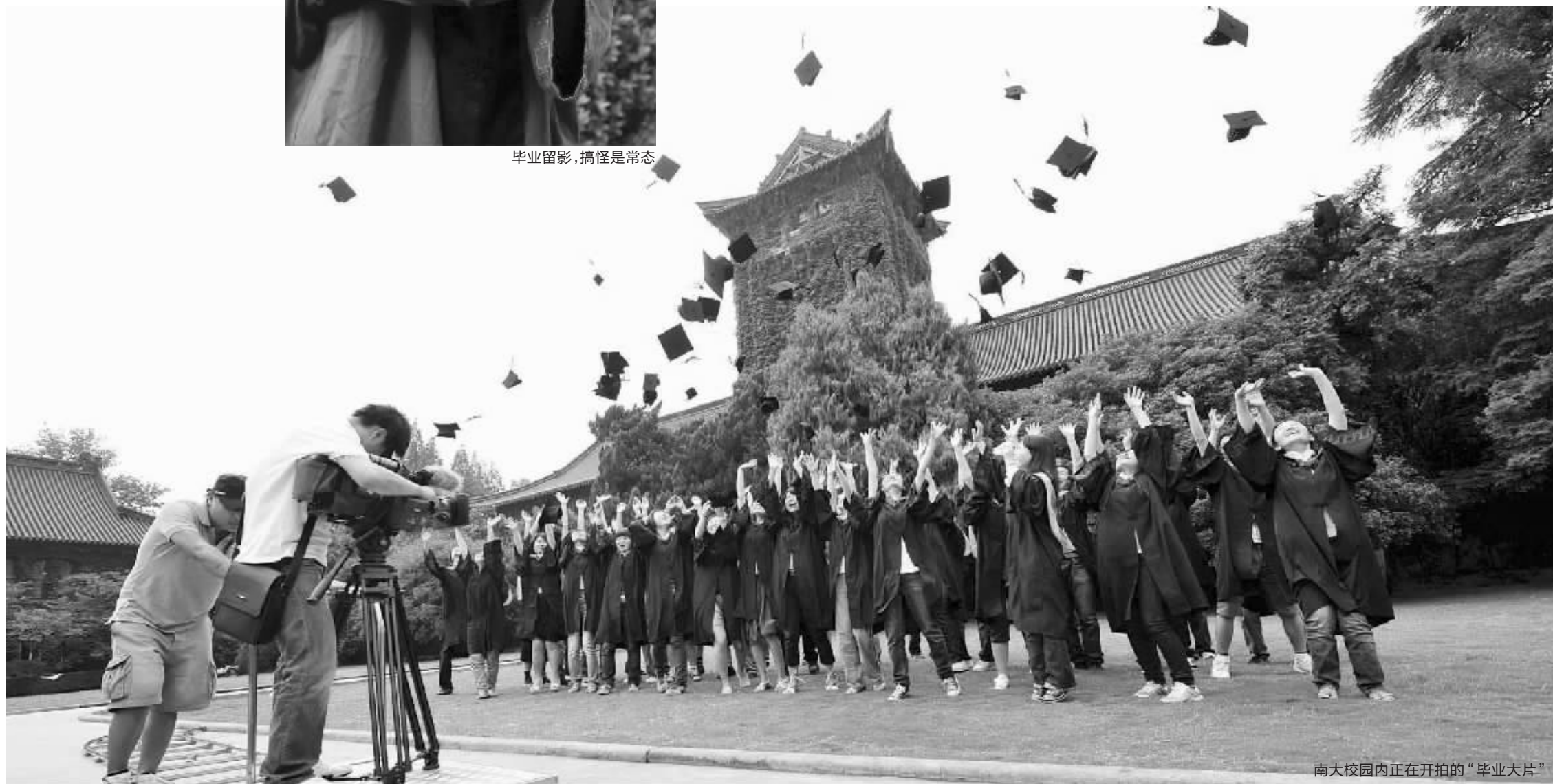
南大校园内正在开拍的“毕业大片”