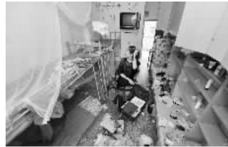
看着空落落的宿舍,自己心里也空落落地起来