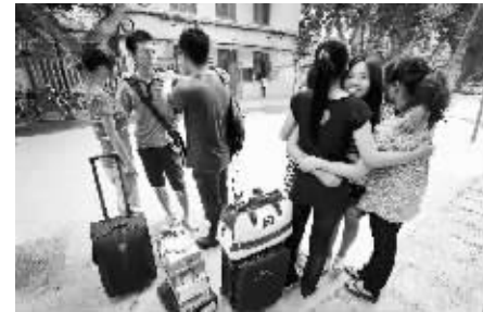
即将毕业,各奔东西,浓浓的离愁别绪