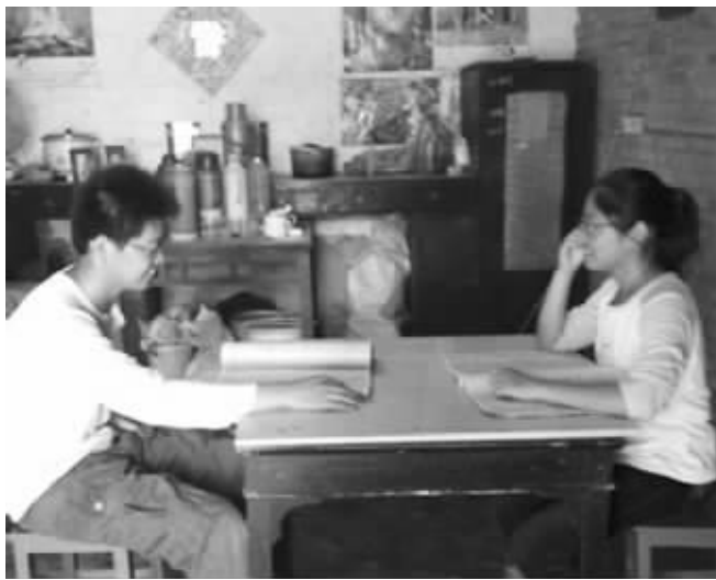
龙凤胎兄妹还不知道父母在为学费犯愁呢

上初一那年,光是择校费就要交13500元。那时,老陆在工地上做瓦工,十几块钱一天,妻子在县里的服装厂打工,一个月挣两三百块钱,负担不起这笔费用。“只能向亲戚和村里头的人借钱。”老陆说,两个孩子读中学