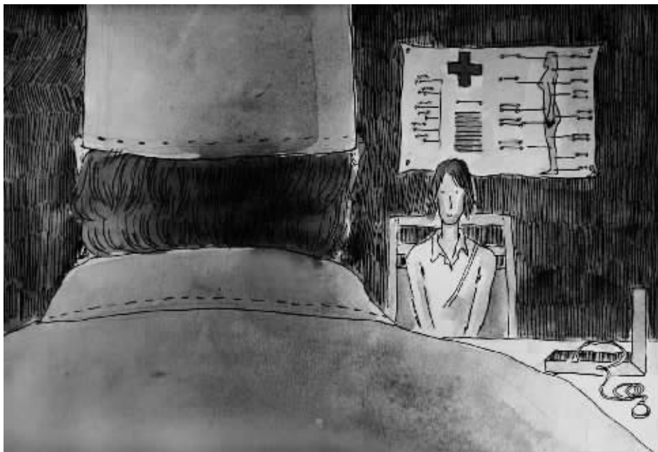
绘图/鲁嘉 插画师 美国 SND 插图奖获得者 已婚

爱情的光鲜需建立在若干细节的基础上。女友远去，小伙深受刺激，不好说谁对谁错，冷暖自知。好在医生表示，小伙能够恢复健康。