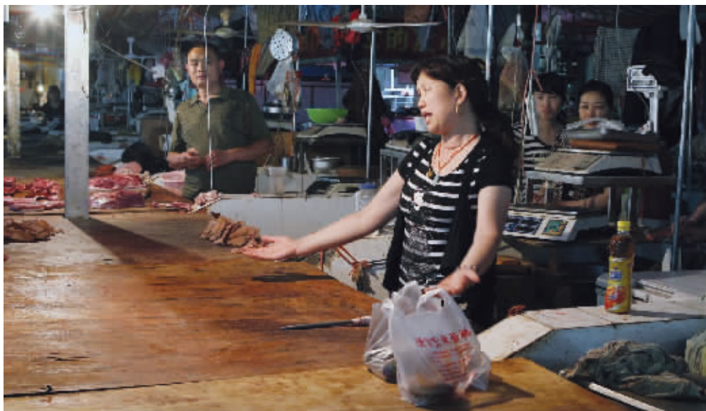
被偷摊主一脸无奈