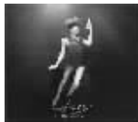
专辑:《Billie-Eve》 歌手:Ayo 评分:★★★★☆

现居法国的德国籍创作女歌手Ayo,她的唱腔和风格涉及民谣、爵士、灵魂、雷鬼等,无需太多乐器润饰,就可以震撼每个人,《Billie-Eve》是她2011年最新的大碟。Ayo有一副非常人所及的会跳舞的嗓子,大的高难度作品她能轻松驾驭,小歌也会唱得让人听了如醉如痴,这是很多大牌都做不到的,但Ayo能做得很好。