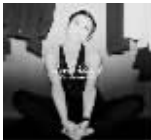
专辑:《Love Addict》 歌手:刘美君 评分:★★★★

现居法国的德国籍创作女歌手Ayo,她的唱腔和风格涉及民谣、爵士、灵魂、雷鬼等,无需太多乐器润饰,就可以震撼每个人,《Billie-Eve》是她2011年最新的大碟。Ayo有一副非常人所及的会跳舞的嗓子,大的高难度作品她能轻松驾驭,小歌也会唱得让人听了如醉如痴,这是很多大牌都做不到的,但Ayo能做得很好。