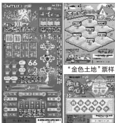
“恭喜发财”票样 “永结同心”票样