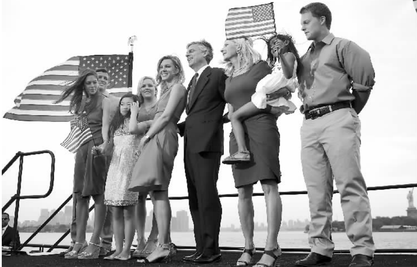
6月21日,美国前驻华大使洪博培(中)在美国新泽西州发表演讲宣布角逐共和党总统候选人提名后和家人合影