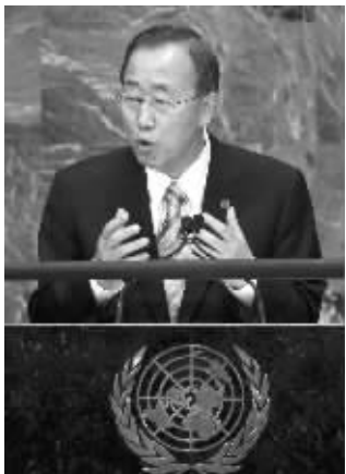
潘基文连任联合国秘书长

潘基文强调,今后联合国安理会工作的重点是加强应对全球气候变化、削减核武器、促进中东和平进程以及推进北非的民主化进程。他自己将继续在国际事务中扮演“搭桥人”和“催化剂”的角色。