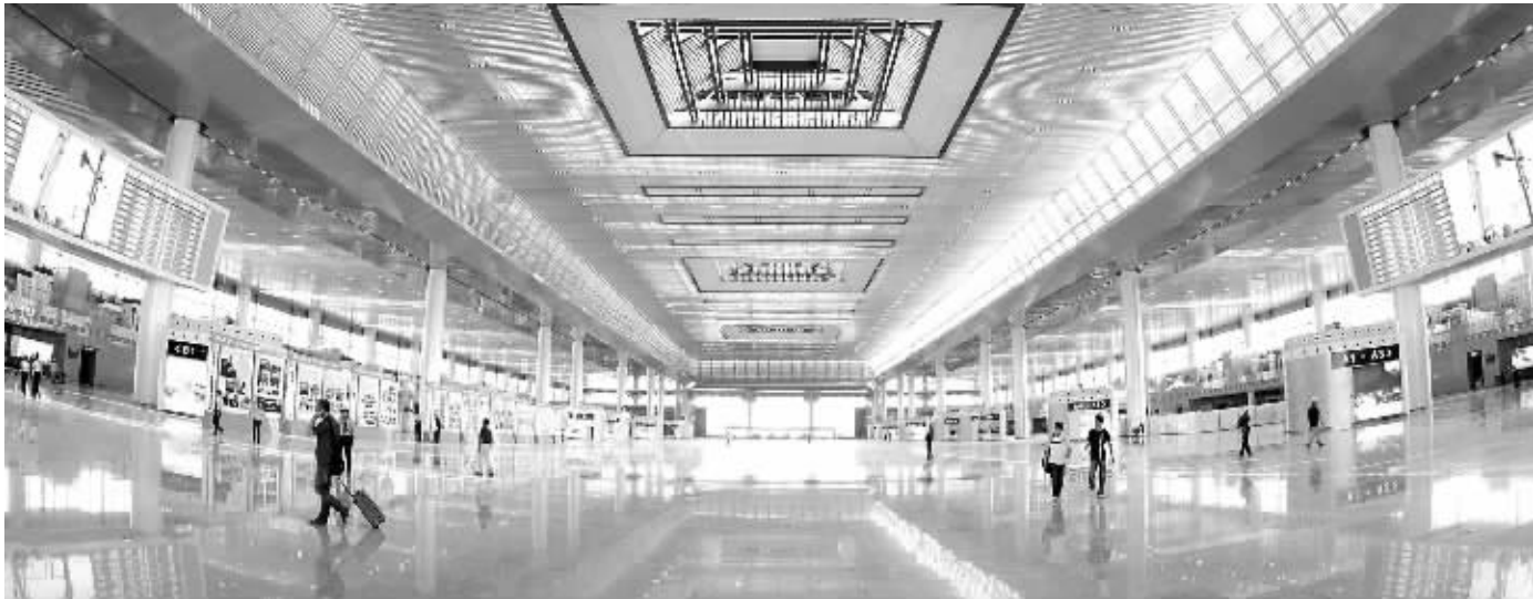
铁路出发大厅(铁路候车大厅)透明自然采光设计