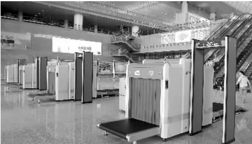
出发大厅北入口安检口

上海铁路局副局长关群告诉记者,与现有火车站不同的是南京南站分为付费区和非付费区,没有买票的市民进入非付费区(旅客出站),只需经过危险区安全检查即可进入非付费区(3楼出发层),“OPEN”式的,除了二楼其他地区全部对市民开放。”