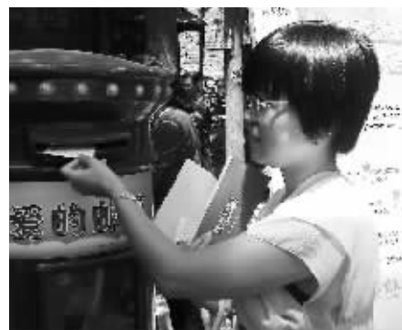
“让爱情邮筒传递我的缘分”

活动时间：每周六10:00-15:00 活动地点：玄武湖杉林氧吧(玄武湖公园进玄武门后左转即到) 活动咨询热线：96060（快报24小时热线）84783681（9:00-21:30周末不休） 地铁：地铁1号线南延线 地铁1号线（玄武门站下） 公交线路：游1路 1路 3路 8路 15路 22路 25路 26路 28路 30路 33路 35路 38路 47路 52路 56路 74路 114路 801路 802路 819路（玄武湖公园下） 友情提醒：现代红娘们提倡大家诚信相亲、文明相亲，同时注意保密个人重要信息免受侵害。