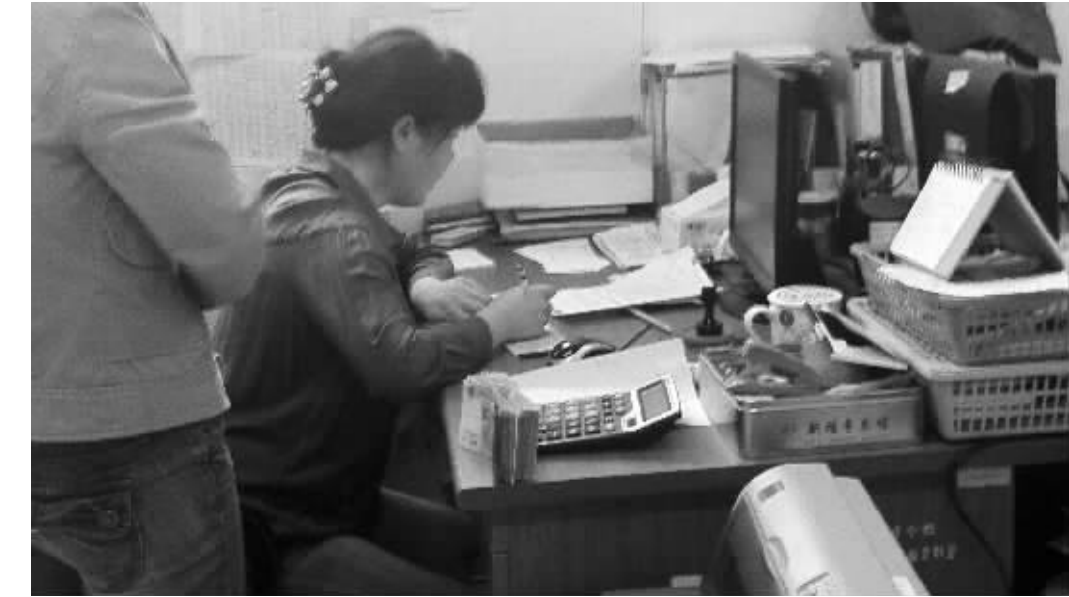
学校财务人员正按照一位家长提供的捐赠协议,为其开具捐赠发票

个字样为“南京师范大学附属中学江宁分校财务专用章”的公章,收款人落款就一个“李”字。用15000元现金换来一张捐赠收据后,该家长拿着收据返回到一楼招生办公室。办公室先前接待的老师接过收据,在电脑屏