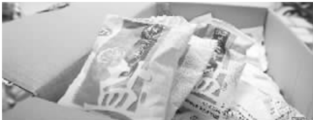
1元盐多家超市断货(资料图片)