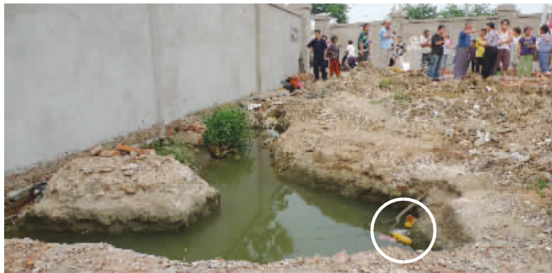
出事的水塘只有五六平方米大,水面上还漂着鞋子

“两个孩子都没了,这两个家庭怎么办啊!”“如果父母看得紧一点,如果工地能封闭起来,也许悲剧就不会发生!”……昨天下午,石杨路西头小杨庄附近一个拆迁工地内发生惨剧,两名孩子在工地一个只有五六平方米的水塘里溺亡。这起惨剧给家长们敲响了一记警钟:暑期将至,千万要注意孩子的安全。