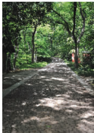
通往戴笠墓的弹石路

除了两块大石头,荒草中还掩着一个和石制棺盖大小相仿的深坑。坑内荒草丛生,并无他物;坑的四围,则是用整齐的砖石砌成。冯德奎说,这就是传说中的戴笠墓穴了。