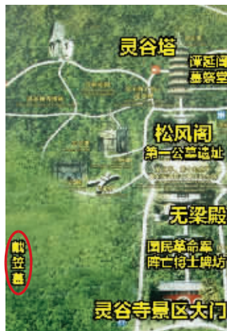
戴笠墓址示意图 制图 李荣荣