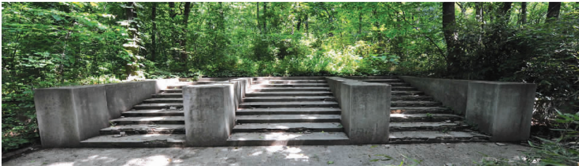
沿着台阶上去,就是戴笠墓所在,如今只有残碑卧于地面。台阶侧面,有游客书写的“戴笠”字样