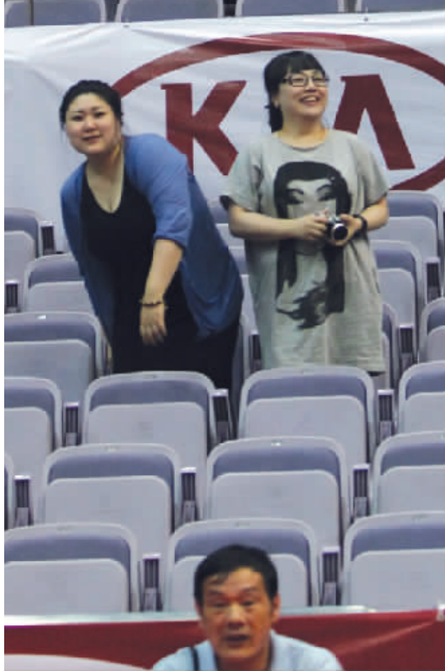
昨天,即使是中国队和韩国队的比赛,奥体馆内仍有不少空的看台