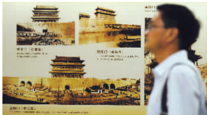
明代两京城墙展