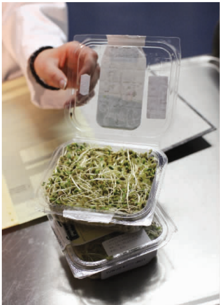
6月6日在位于德国奥尔登堡的德国消费者保护和食品安全下萨克森州办公室拍摄的一盒芽苗菜,这盒芽苗菜产自该州比嫩比特尔的一家被疑是疫情传染源头的农场。

德国国家疾病预防和控制机构10日确认,德国本土出产的芽苗菜是这一轮肠出血性大肠杆菌疫情源头。德国北威州消费者保护部当日称,首次在芽苗菜上查出造成肠出血性大肠杆菌感染疫情的O104:H4型大肠杆菌。确定“毒源”后,西红柿、黄瓜、生菜等蔬菜有望摘掉“生食禁令”的帽子。