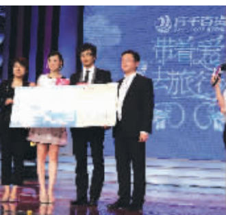
王赵子琪与少女作家蒋方舟等公众人物将全程担任活动的明星评审,与万千百货共同甄选出能够登

2011年6月9日,“2011万千百货——带着爱去旅行”活动启动仪式暨新闻发布会在北京盛大举行。万千百货、周大生珠宝及歌诗达邮轮的高层领导与来自国内数十家知名媒体的记者及众多来宾共同见证了这一精彩时刻。 “2011万千百货——带着爱去旅行”活动由万千百货发起、光线传媒承办。活动以爱情作为万千百货“爱系列”的主题,力邀全国100位情侣同享歌诗达经典号豪华邮轮,共赴韩国釜山与济州岛,开启为期五天的甜蜜之旅。新闻发布会现场,主办方万千百货宣布收视女