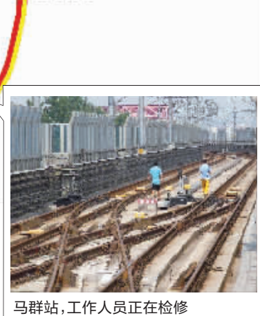
马群站,工作人员正在检修