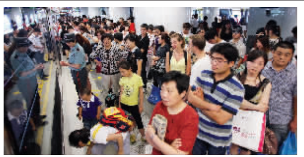
地铁延误,大量乘客聚集在站台

马群地铁站发生故障后,地铁调度部门将开往仙林方向的地铁终点站临时改为钟灵街站,导致钟灵街站一时间大量乘客滞留,而这些乘客,大部分是去仙林方向的。地铁公司表示,已经联系好大巴前来,将安排他们乘坐大巴离开。事发后约半小时后,大巴到达钟灵街站,将部分滞留乘客送往仙鹤门站,再转乘地铁去仙林,而其他滞留乘客则自行换车出行。