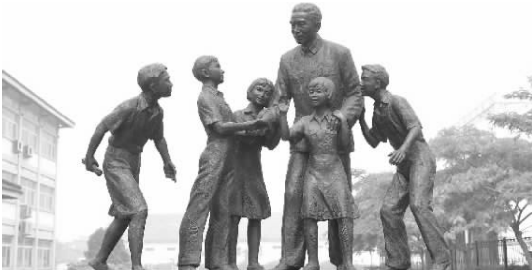
抗战期间，周恩来在桂林看望新安旅行团团员的雕像