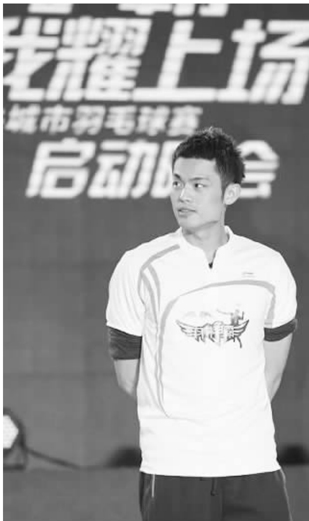
林丹助阵“羽林争霸”