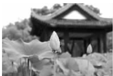
莫愁湖的荷花开了

市民朱先生:昨天去莫愁湖公园玩,发现园子里的荷花已有一些开放了。据我所知,荷花一般在7月初开放,7月中旬进入盛花期,今年的荷花,整整提前了一个月。今年春天的花,比往年开得要晚半个月左右。为什么夏天的花,脚步却来得这么快?