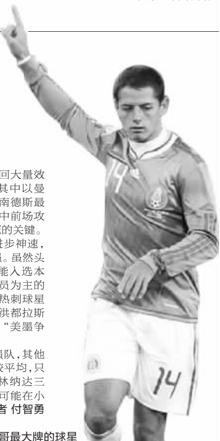
埃尔南德斯是墨西哥最大牌的球星

除了传统的三支强队,其他本地区球队的实力比较平均,只有古巴、瓜德罗普、格林纳达三支球队实力较弱,最有可能在小组赛中被淘汰。快报记者 付智勇