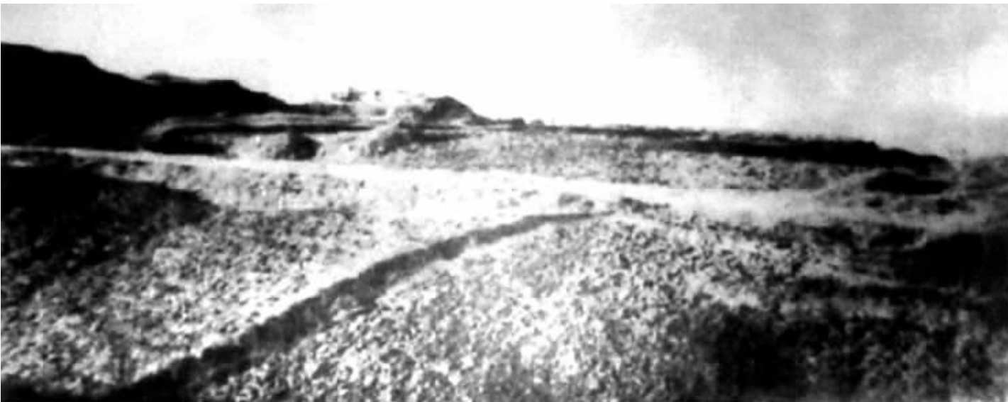
老照片中的北固山刑场,当年许多革命志士在此英勇就义