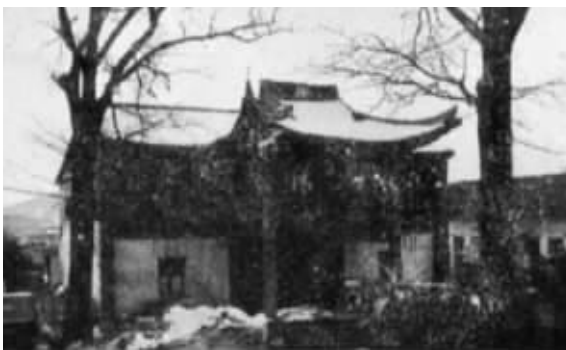
临时军法会审处(旧址)