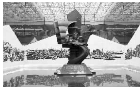
镇江烈士陵园中的红色雕塑