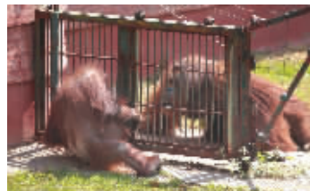
乐申隔着电网向红宝吐口水示好