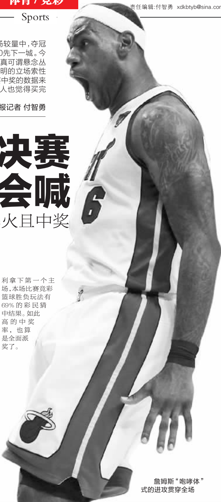
詹姆斯“咆哮体”式的进攻贯穿全场

利拿下第一个主场,本场比赛竞彩篮球胜负玩法有69%的彩民猜中结果。如此高的中奖率,也算是全面派奖了。