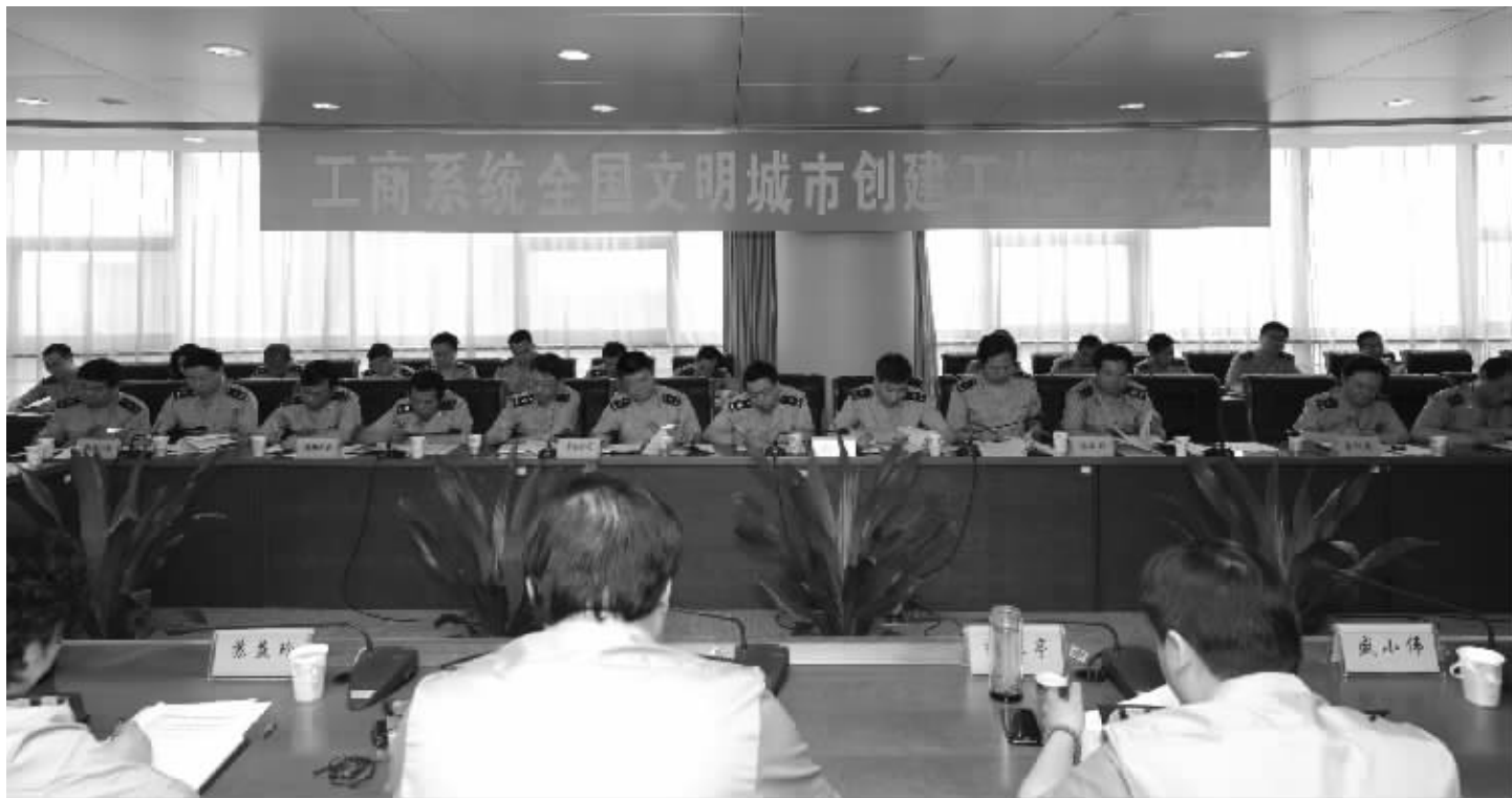
工商局召开全国文明城市创建工作部署会