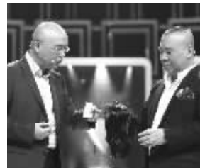
孟非:回赠你顶假发

在不久前揭晓的“福布斯中国名人财富榜”上,郭德纲以2000万元年收入排名第22位,自然引起了大家对他加盟《非常了得》酬劳的关注。对于酬劳有多少的问题,郭德纲巧妙答道:“这还真不清楚,我对钱没概念的。而且这次来,我还交了‘实习费’呢!”至于“实习费”具体是多少,为何而交?郭德纲不愿多透露。