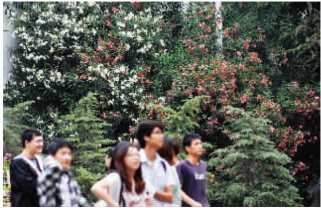
在南京,夹竹桃是一种很常见的植物