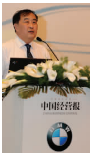
BMW中经智库专家、住房与城乡建设部政策研究中心主任陈淮发表主题演讲

中国社会科学院是BMW中经智库的智慧支持单位。智库由来自于经济金融、国际问题、社会政法等各个领域的16名资深专家组成。他们学术成就高、具有威望,且在商业、学术或相关领域成就斐然贡献突出。BMW中经智库全国行活动将从5月起在全国12个城市展开。