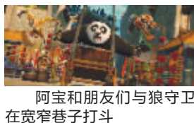
阿宝和朋友们与狼守卫在宽窄巷子打斗

在《功夫熊猫2》公映之前,出品方梦工厂坦白了真相——在制作《功夫熊猫》时,全剧组的人都没有见过真正的熊猫,他们靠的只是网络搜索而已。片中的中国元素全都来自拼凑和参考。《功夫熊猫2》的艺术总监雷蒙德也是第一部的美术指导,他透露:“在拍摄《功夫熊猫》时,我们主要参考了中国的传统山水画,还有很多成功的功夫电影:比如李安的《卧虎藏龙》,里面绿色的竹子让人印象深刻;还有张艺谋的《英雄》,那种借助色彩的不同来讲述故事、塑造人物的手法;当然,还有成龙的电影,甚至一些更早的功夫片。那个时候,我们对熊猫的创作,主要依靠收集关于熊猫的书籍和图片。”