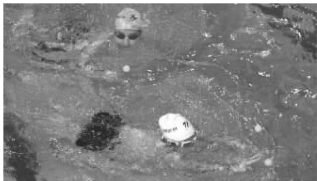
孩子们以各自擅长的泳姿奋力打捞水中的乒乓球

快报讯(记者 黄艳)40秒水中打捞乒乓球,一分钟“海底寻宝”、自由泳男女生接力……昨天上午,南京首次中学生水上运动会在九中弘光分校举行。这所学校在南京市率先将游泳作为必修课排入课表,全校1100多名学生个个会游泳。