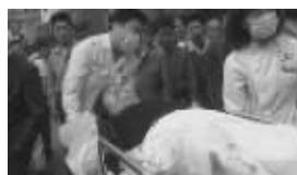
另一名受伤女子被抬走