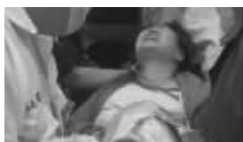
被卷入车底的女子