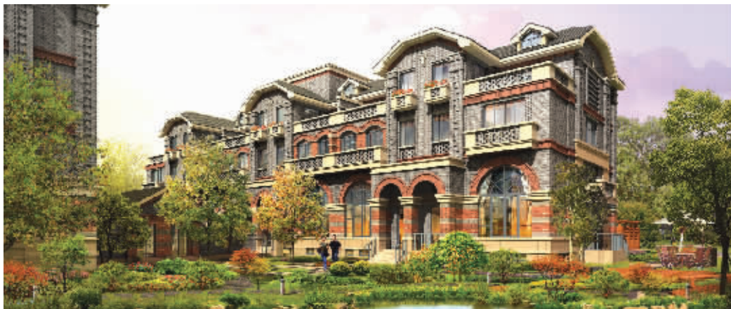
宏图上水庭院打造的是个性分明的复古民国别墅

在南京, 最充沛的财富流属于新街口, 而最具潜力的财富通道, 则指向南京南站。新旧两大城市中心, 连成一条巨大的黄金矿脉, 而在这条财富线上, 宏图上水庭院以沉静怀旧的民国别墅姿态处变不惊, 安然享受一切价值攀升的利好, 同时也成为颇受高端置业者青睐的终极居住目标。