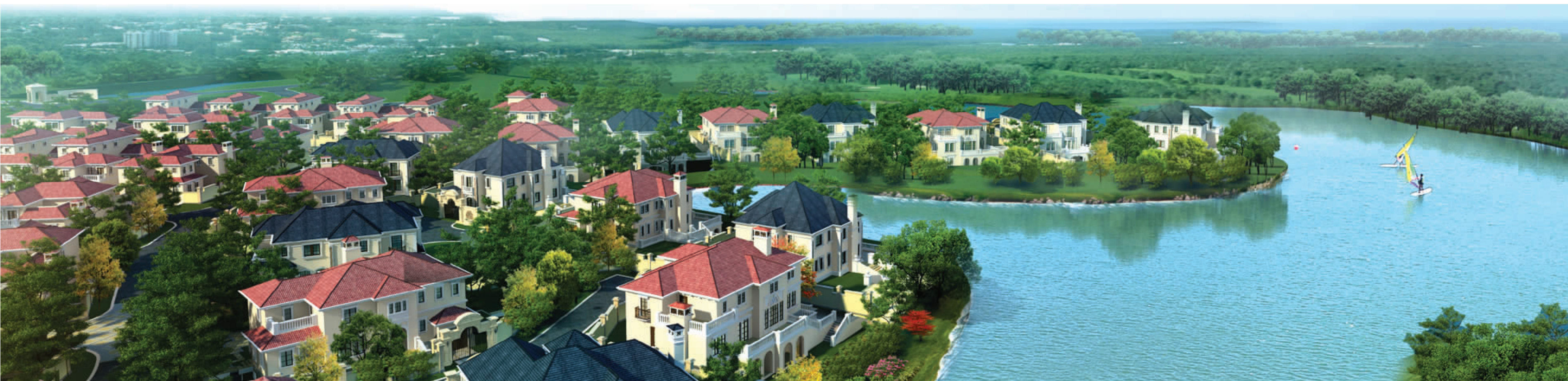
在青溪庄园,一个家庭、一个家族可以繁衍兴盛,乐享生活

咎繇村的新石器文化、清朝大侠甘凤池故地、唐朝的宰相、巨龙的传说……一方土地自有养育一方人的风水,人杰地灵的历史文化积淀,野史正史都留下过笔墨。竹海清幽绝俗,湖泊星罗棋布,林涛拂去红尘,山泉洗出冰心,鸟语忽远忽近,花香若有若无,地理条件、气候条件、动植物资源、自然地形地貌、人文资源、旅游资源深入调研挖掘。从梵蒂冈城到法国的巴黎,从意大利的罗马、佛罗伦萨、威尼斯到瑞士,再到列支敦士登的国王城堡,都留下了中浩寻梦的脚步。