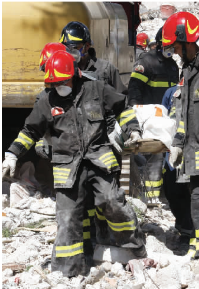
2009年4月7日,意大利消防员在拉奎拉一幢倒塌的建筑中紧张救援

意大利《共和国报》援引检方起诉书报道,正是重大危险委员会成员的安抚性结论,“使灾民相信,可以留在家中”。