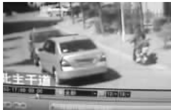
骐达女车主回到车上,两车“相顶”