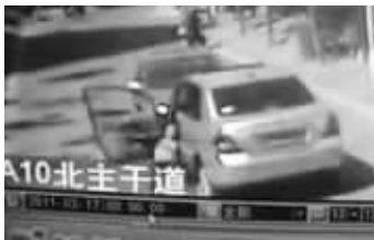
POLO车撞过来,骐达女车主倒地