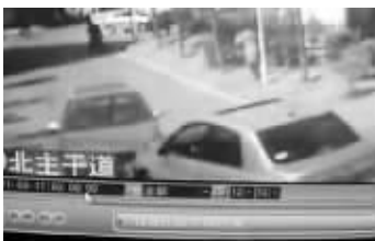
POLO车再次撞来,幸好没撞到人