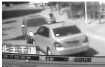
两车僵持,骐达女车主与对方理论

记者从这位版主手中拿到了视频中女车主的联系方式,电话接通后对方却一直含糊其辞。在记者的反复追问下,她说自己的确是视频中的主角:“那个被撞的就是我。”但是当记者询问她为何会和另一辆车的车主有争执时,她却一直说电话听不清,随后挂掉了电话。之后记者不断拨打她的手机,一直是无人接听状态。