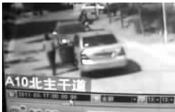
骐达女车主再次下车想跟对方理论