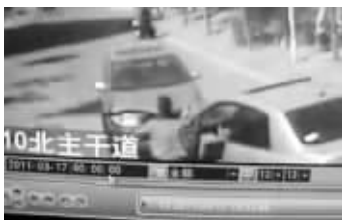
骐达女车主爬起来继续说着什么