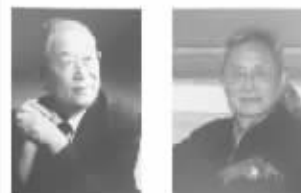
北大医院郭应禄院士 中科院郑万勛教授 主持研发 国际男科最新成果