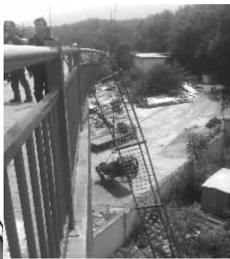
护栏被撞开