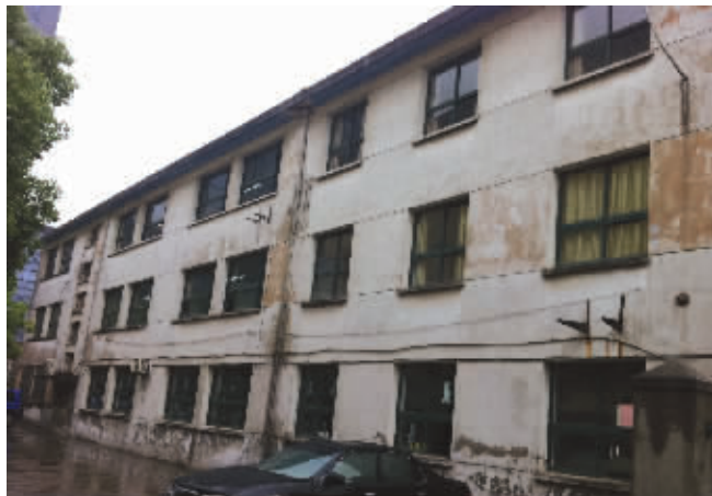
小飞摔出的窗口在三楼教室的背面

据小飞的大伯戴先生介绍,小飞今年11岁,老家在安徽省临泉县,父母都在无锡打工。约一个月前,父母把他从老家接来无锡,安排到蠡桥小学学习。来了之后发现,小飞的学习成绩比同年级的学生差很多,尤其是英语,蠡桥小学的学生从三年级就开始学英语了,小飞对英语却几