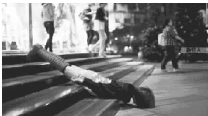
网友晒出的各种趴街族趴街照片。

前阵子,日本的“浮游少女”引发了一波轰动的浮游照热潮。近来浮游热刚有所减退,一种名为“趴街”(又称“仆街”,英文为planking)的古怪行为艺术又席卷而来,令网友感慨“只要搞怪就会红”。