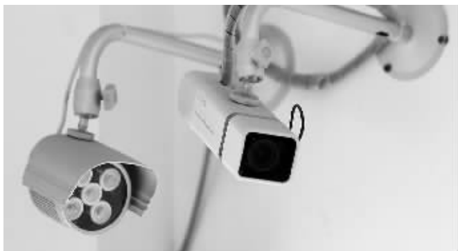
这个点上有两套监控设备一起工作

博物馆“重镇”有两个:展厅和库房。但不管是库房还是展厅,那都是摄像头、红外、报警器的天下。