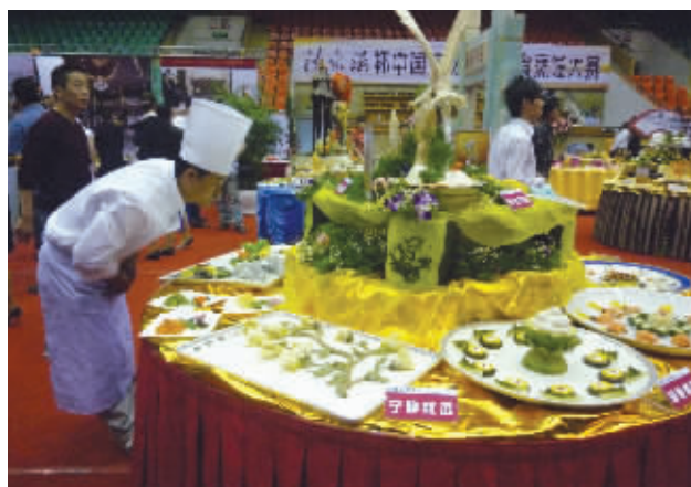
琳琅满目的江南美食吸引了众人驻足观看