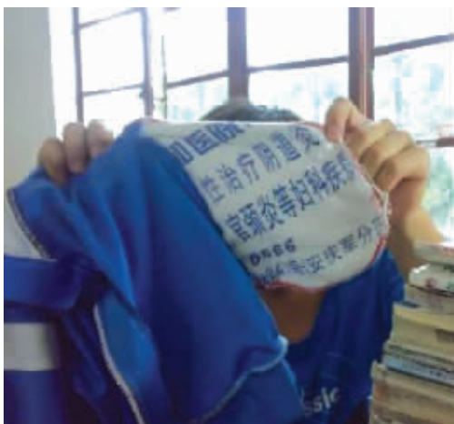
做校服的厂家,你们业务很宽泛啊