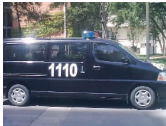
加长型110,110中的福尔摩斯