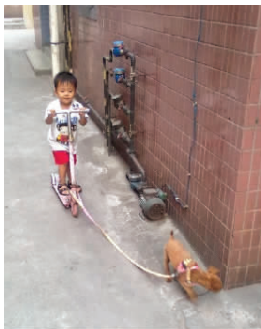
狗拉雪橇什么的,大概跟这差不多