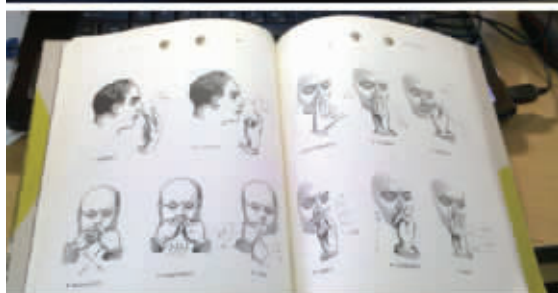
终于明白什么叫“行行出状元”了