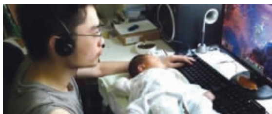
老爸,你换尿布也这么专注就好了