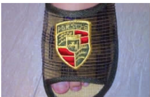
新买了保时捷,第一次没敢跑太快