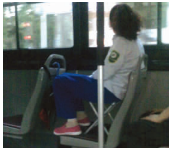
我只是,不想错过沿途的风景