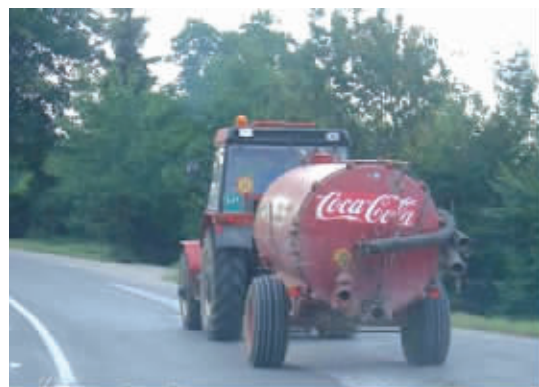
2.5L装的算啥,你看看这家伙