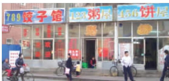
对不起,我们实在想不出好名字