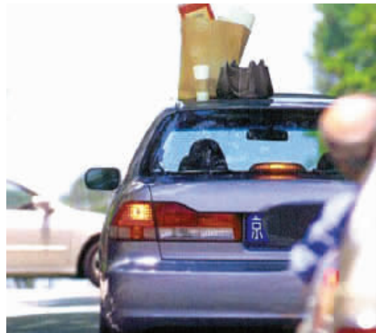
前面那位,你记性也太差了把