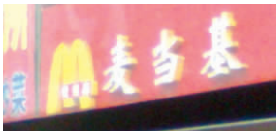
个人以为还是“肯德基”稍微好听一些