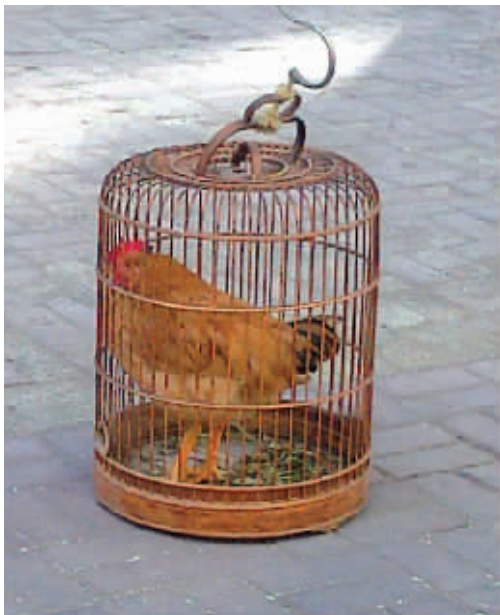
一年前养了个小鸡仔,现在该怎么办!