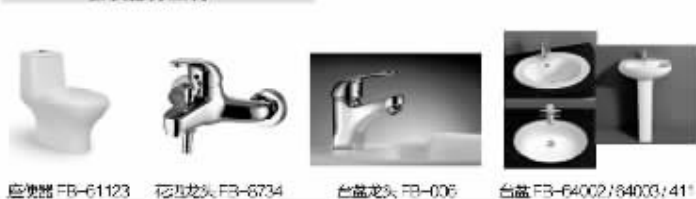
座便器 FB-61123 花洒龙头 FB-6734 台盆龙头 FB-006 台盆 FB-64002/64003/411